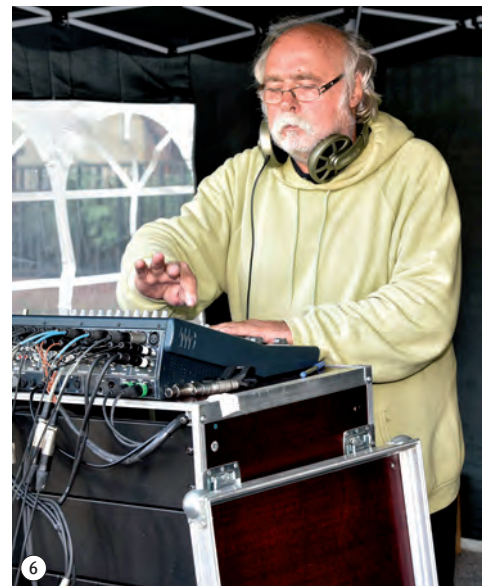
1 Die Organisatoren. 2 Fröhliche Besucher. 3 Kleine Künstler. 4 Attraktive Stände. 5 Schwungvoller Auftritt der Kiezband. 6 Ohne Technik geht es nicht. Fotos 1, 2, 5 und 6 von Wolf Rüdiger Rast; 3 von Beate Köhler; 4 von Marion Kunert