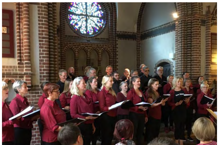
Singen macht glücklich: Cum Gaudio in der Kirche.

Schlittenfahren in der Schönholzer Heide