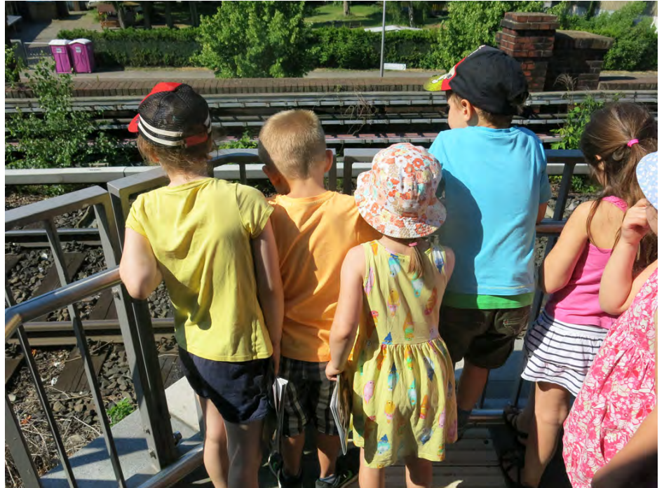
Ich sehe was, was du auch siehst: Schienen, Toilettenhäuschen ...!

Im Laufe des Kurses stellte sich heraus, dass alle Beteiligten ähnlich auf ihr Lebensumfeld schauen: Sie mögen den Garibaldspielplatz, weil es dort so