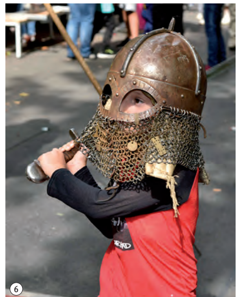
1 Im Gespräch. 2 Ratloser Bürgermeister? 3 Vielfalt in Wilhelmsruh. 4 So schön kann Tanz sein. 5 Was ich noch zu sagen hätte ... 6 Typisch Junge.