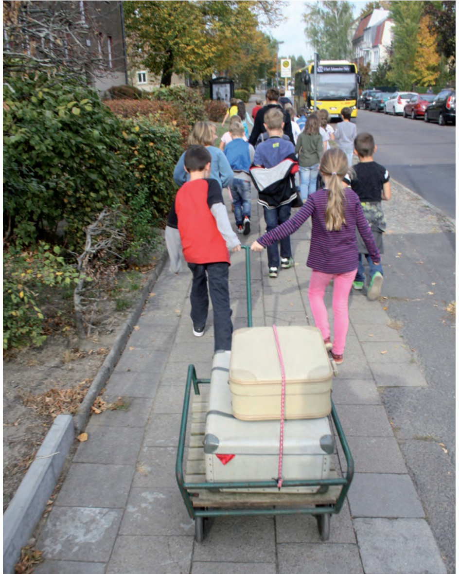
Die Bücherkoffer auf dem Weg in die Schule.