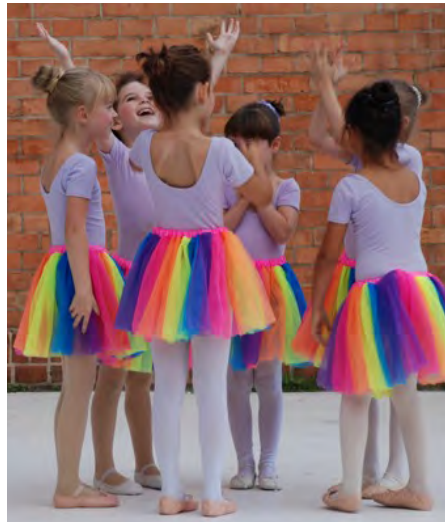
Sind sie nicht süß ...?