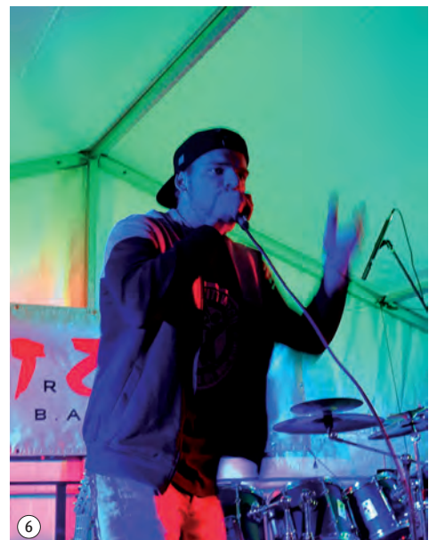
1 Großer Zuspruch bei den Auftritten. 2 Begeisterung mit Chic. 3 Letzte Absprachen. 4 Spiegeln, Spiegeln an der Wand .... 5 Rock am Abend. 6 TiSoS rappt.