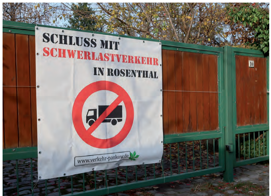
Auch in der Kastanienallee wächst der Unmut.