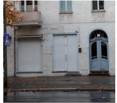
Auch hier: Ein trauriger Anblick.