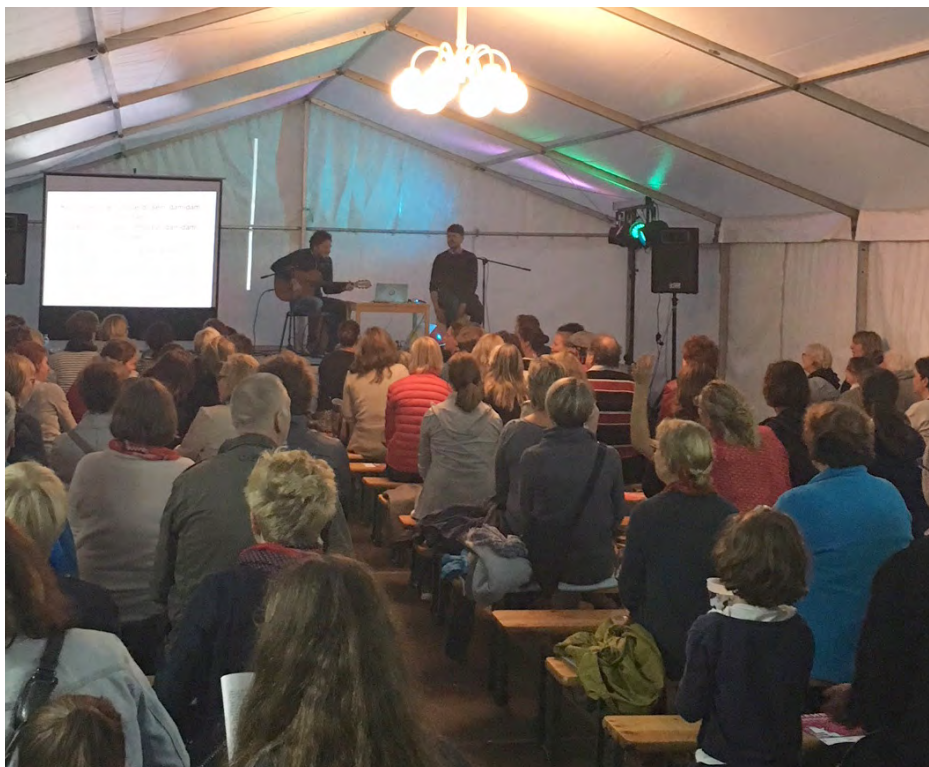
Stimmungsvoller Auftakt im Festzelt.