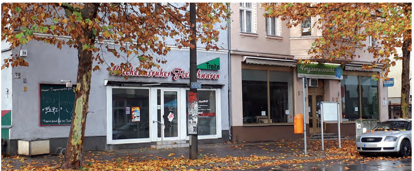
Wann müssen wir nicht mehr in leere Läden schauen?

Dorfläden: Sie sind zunächst darauf ausgerichtet, zumindest den Grundbedarf an Nahrungsmitteln zu decken. Organisation und Trä-