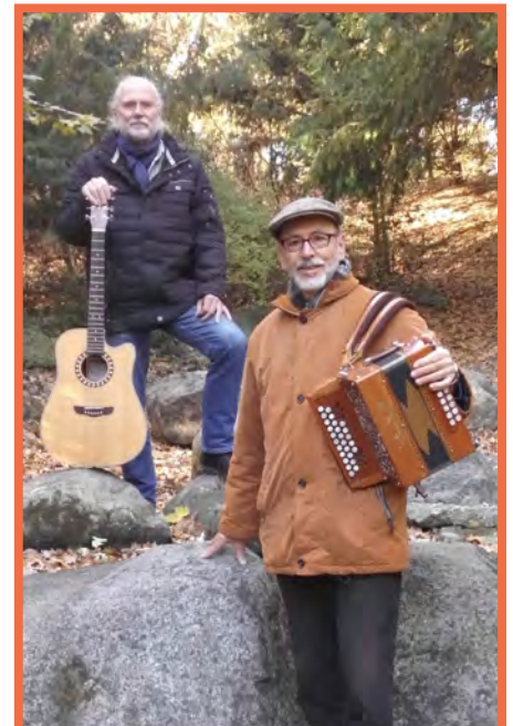
14. Dezember 2018 um 19 Uhr in der Bibliothek Weihnachtskonzert mit dem Duo „Balgerei und Saitengriff“ – Mitsingen erwünscht!