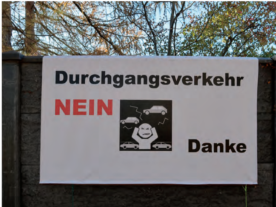
Nicht nur die Anwohner des Waldsteges sind genervt.

Bürgerinitiativen fordern Konzepte gegen Beeinträchtigung der Lebensqualität