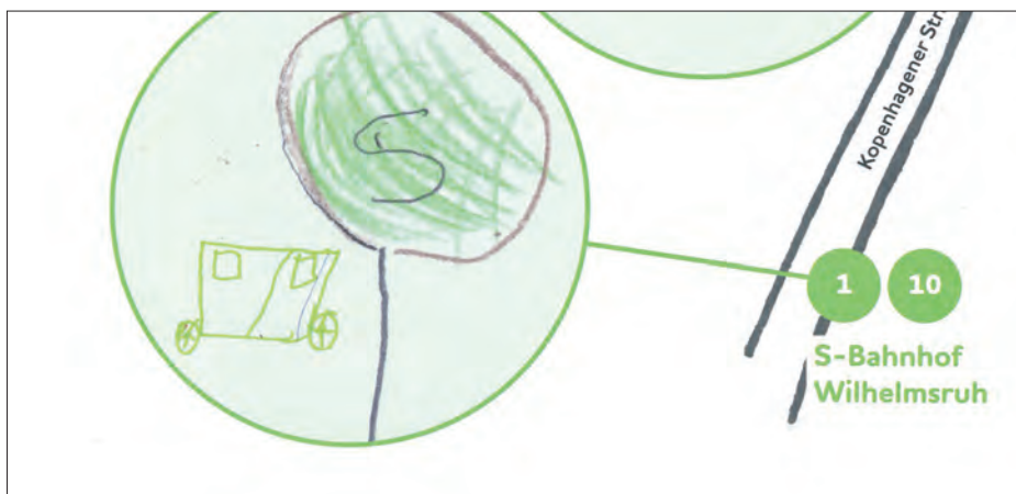
Auszug aus dem Faltplan.