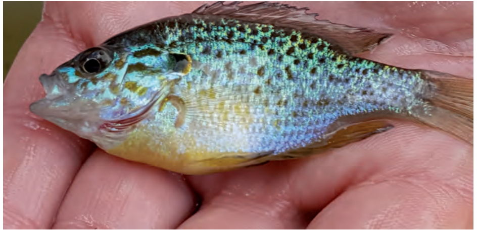
Kaum zu glauben – Fisch aus dem Wilhelmsruher See.

kompetenten Gesprächspartnern des Bezirksamtes und der Senatsverwaltung auszutauschen. Auch diese Begegnungen tragen dazu bei, dass der interessierte Nachwuchs sich eine Meinung bildet und lernt, diese in der Öffentlichkeit zu vertreten. Aktuell verfolgt man als nächstes Ziel, bei der Bezirksverordnetenversammlung im April 2019 mit dem Anliegen „Wir wollen den Wilhelmsruher See retten“ vorzusprechen. Außerdem ist geplant, in den kommenden Wochen im Auftrag des Umweltamtes Panikow eine neue Informationstafel am Wilhelmsruher See aufzustellen. Diese soll auf die negativen Auswirkungen des Entenfütterns hinweisen und wurde kreiert von Kindern der Klassen 1-4 im Rahmen des Umwelt- und Naturprojektes