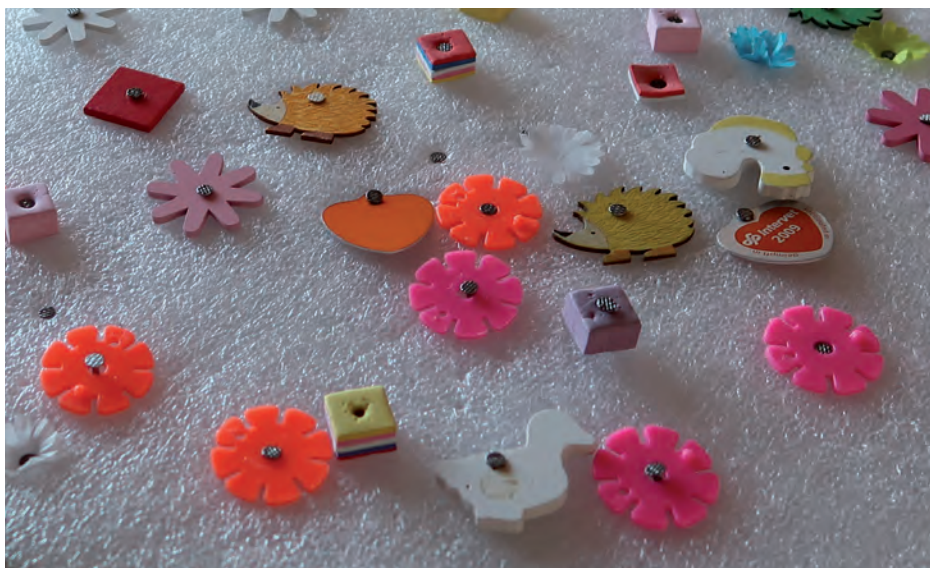
Übungsmaterial zur Schulung der Feinmotorik.

Dass diese Aufgabe für das Personal ebenso anspruchsvoll wie erfüllend ist, betont Finger mehrfach im Verlaufe des Gesprächs. „Sie kann tatsächlich viel Spaß machen und sollte stets mit einer Prise Humor bewältigt werden“, fasst er sein Credo am Ende zusammen. Nicht ohne kritisch hinzuzufügen, dass er sich gelegentlich mehr gesellschaftliche Anerkennung für seine Einrichtung und die dort Tätigen wünsche. Er hoffe für die Zukunft auf günstigere Rahmenbedingungen, die diese Arbeit mit behinderten Erwachsenen für einen größeren Interessentenkreis noch attraktiver machen würden.